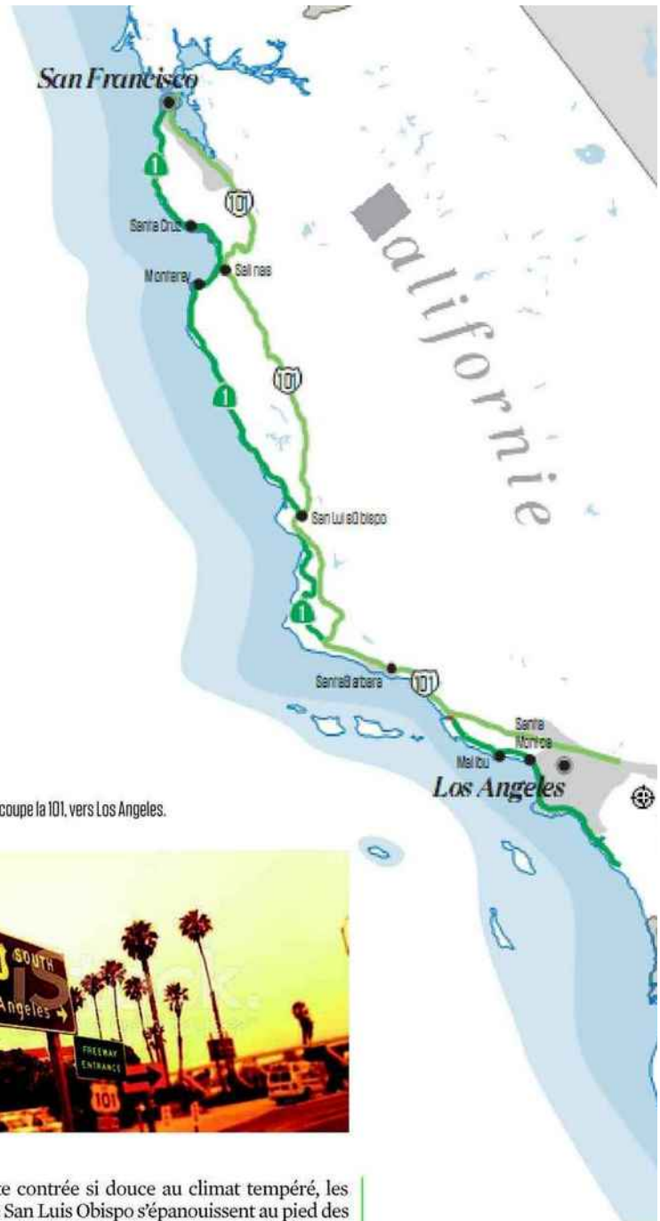
Quand la One coupe la 101, vers Los Angeles.