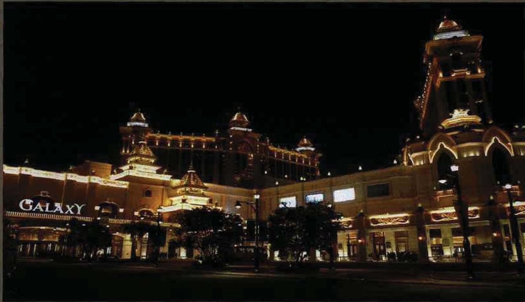
LES COUPOLES EXCENTRIQUES DE L'HÔTEL GALAXY SUR L'ÎLE DE TAIPA. FABRICATION DE GÂTEAUX CHINOIS TRADITIONNELS.